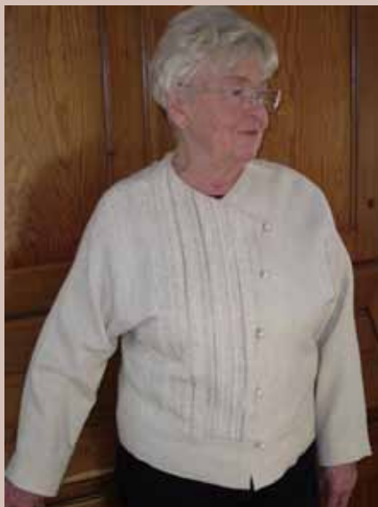
Jacka i tuskaft Varp: stickgarn i merinoull Inslag: ojämt spunnet bomullsgarn