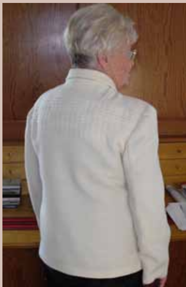
Jacka i amerikanskt mönster (?) Varp och Inslag: ull