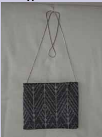
Väskan är vävd i damast, 20 drag Varp: Merc. bomull obl. 16/2 Inslag: Färögarn 1 tr. svart och 1 tr. silver Sked: 60/10, 16 tr./cm